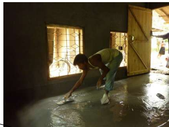
Fine couche lisse de mortier

Chaque pièce a été équipée d'un ventilateur électrique et de lampes ainsi que de prises de courant pour d'autres appareils électriques. Nous avons également fixé des lampes au plafond de la véranda.