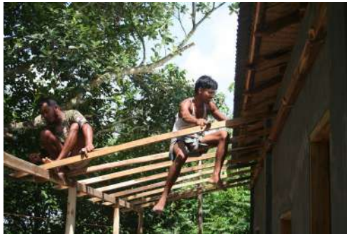
Toit de la véranda