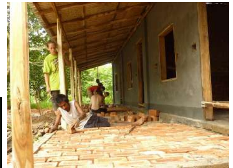
Aménagement du sol en briques

Après quoi nous avons entamé les travaux de finition: les maçons se sont occupés à enduire les murs de ciment (au Bangladesh on ne plafonne pas à cause du taux d'humidité important) et les charpentiers ont terminé le toit. Pendant ce temps nous avons installé le réseau électrique (pour lequel la connaissance des étudiants ingénieurs fut très utile) et pourvu les trois pièces ainsi que la véranda d'un sol en briques, qui fut recouvert d'une fine couche de mortier. Nous avons également acheté de la peinture blanche, mais nous n'avons pas pu peindre nous-mêmes car la couche de ciment devait d'abord sécher pendant 2 à 3 semaines. Nous avons donc laissé la peinture au personnel de l'hôpital qui, depuis, a peint les parois en blanc.