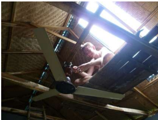
Installation du réseau électrique

Après quoi nous avons entamé les travaux de finition: les maçons se sont occupés à enduire les murs de ciment (au Bangladesh on ne plafonne pas à cause du taux d'humidité important) et les charpentiers ont terminé le toit. Pendant ce temps nous avons installé le réseau électrique (pour lequel la connaissance des étudiants ingénieurs fut très utile) et pourvu les trois pièces ainsi que la véranda d'un sol en briques, qui fut recouvert d'une fine couche de mortier. Nous avons également acheté de la peinture blanche, mais nous n'avons pas pu peindre nous-mêmes car la couche de ciment devait d'abord sécher pendant 2 à 3 semaines. Nous avons donc laissé la peinture au personnel de l'hôpital qui, depuis, a peint les parois en blanc.