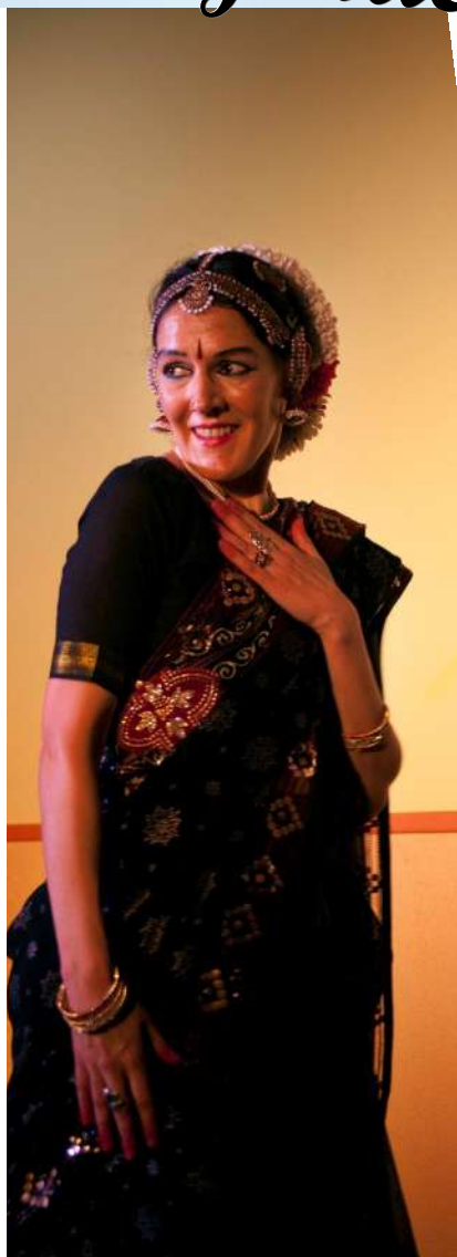
Photo prise lors de notre spectacle au profit du projet (danseuse Bollywood)